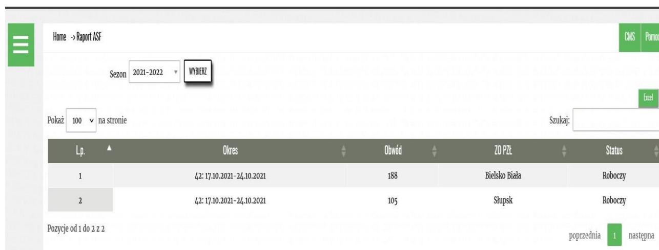
Rysunek 2. Wybór obwodu oraz sprawozdawanego tygodnia

W menu dla uprawnienia Łowczy (Rysunek 1) wybieramy zakładkę Sprawozdania ZO po otwarciu okna wybieramy przycisk SPRAWOZDANIE TYGODNIOWE ASF (Rysunek 2)